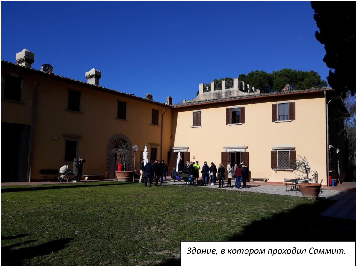
Здание, в котором проходил Саммит.

С 20-го по 25-е февраля мы с Ниной провели в Италии. Причиной поездки в эту страну было участие в Саммите русско-говорящих церквей Западной Европы, который состоялся с 20-го по 23-е февраля. Это