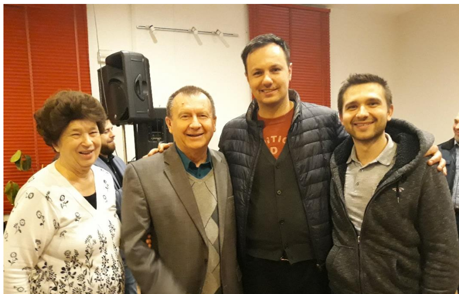
Приятная встреча с земляками и коллегами-миссионерами из Сакраменто, совершающими сегодня служение в Испании.